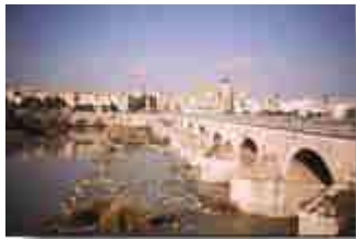
Blick auf Cordoba

Córdoba heißt unser nächstes Ziel und wir nehmen wieder den Zug. Auch hier bemühen wir uns um eine preiswerte Unterkunft. Der Wirt ist uns allerdings nicht sehr gewogen, nachts beschwert er sich einige Male, dass wir zu laut sind und droht mit Rauswurf. Wie kann er nur so verbittert sein, wir haben doch nur Skat gespielt und etwas Wein getrunken – oder etwa nicht?