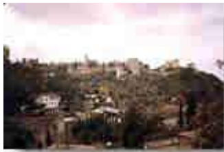
Blick auf Alhambra