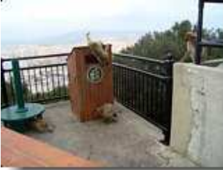
Affen in Position

In der Hotelbar des "Marina Sur" haben die Animatoure das Wort. Zeit für mich, schnellstens das Haus zu verlassen, denn an angenehmen und interessanten Lokalen mangelt es in Torremolinos wirklich nicht.