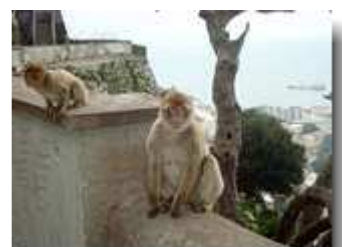
Affen in Position