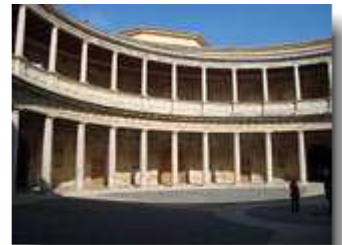
Palacio Carlos V.