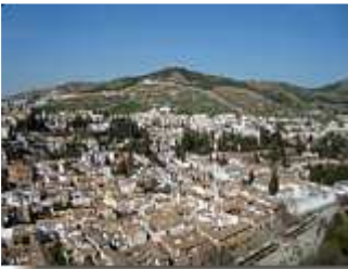
Blick auf Granada

Vor der Kirche werden auf langen Tischen Kräuter aller Art und Teesorten in verschiedenen Variationen angeboten. Die Catedral Santa Maria de la Encarnación wurde auf den Resten einer Moschee gebaut und 1561 eingeweiht. Endgültig fertig gestellt war sie allerdings erst im Jahre 1704. Hohe, mächtige Säulen prägen den Innenraum. Die halbrunde Capilla Mayor bildet das Prunkstück des Gotteshauses.