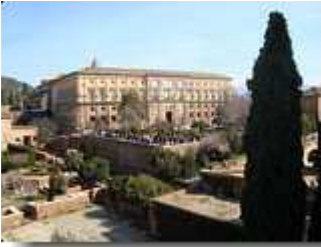
Palacio Carlos V.

absoluter Höhepunkt der Alhambra, als das Glanzstück der islamischen Baukunst – nur, die Löwen sind weg. Tatsächlich, sie werden zurzeit restauriert. Mich stört es nicht so sehr, da ich mich von einem früheren Besuch noch gut an diesen Brunnen erinnern kann. Zur Veranschaulichung erlaube ich mir, in diesem Bericht ein früheres Foto zu positionieren. Der Hof ist von Arkaden umsäumt. In diesem Bereich sehe ich mir noch die Sala de los Abencerrajes mit der herrlichen Kuppeldecke und die Sala de los Hermanas mit ihrer wunderschönen Stalaktitenkuppel an. Die Sala de los Reyes ist geschlossen und kann momentan nicht besichtigt werden.