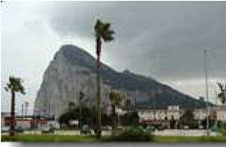
Blick auf Gibraltar

Mit dem Bus geht es zurück, in Marbella muss ich, warum auch immer, das Fahrzeug wechseln. Das Abendessen nehme ich in der Nähe des Busbahnhofs in einer sehr reizvollen Tapas-Bar ein. Erstaunlicherweise herrscht hier in den Lokalen noch kein Rauchverbot.