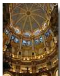
in der Kathedrale