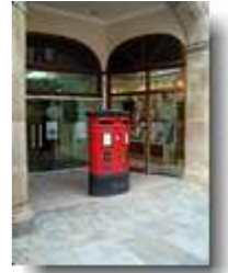
Briefkasten in Gibraltar