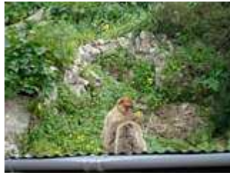
Affen beim Lausen