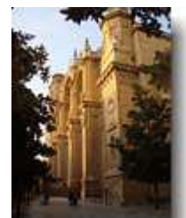
Kathedrale in Granada