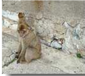
Affen in Position