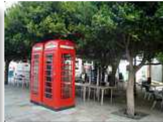
die Telefonzelle könnte in Manchester stehen