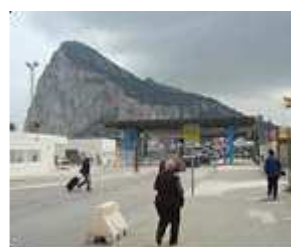
An der Grenze zu Gibraltar