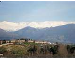
und im Hintergrund die Sierra Nevada

Am Plaza de la Trinidad suche ich mir draußen einen gemütlichen Platz, ruhe mich ein wenig aus und entspanne mich mit ein paar Flaschen Alhambra-Bier. Das Gesehene und Erlebte muss erst einmal verarbeitet werden. Was passt besser dazu als ein Bocadillo Andaluz, ein Brötchen mit Serrano-Schinken und Sobrasada, einer Paprikastreichwurst.