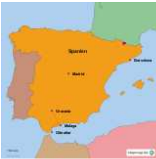
Landkarte von StepMap