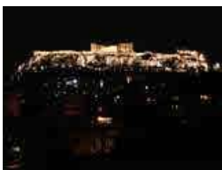
Akropolis am Abend

Wir schlendern gemächlich durch die Plaka und orientieren uns dann in Richtung Akropolis, dem bekanntesten Bauwerk der griechischen Antike. Am Parkeingang sind 12 Euro Eintritt zu entrichten.