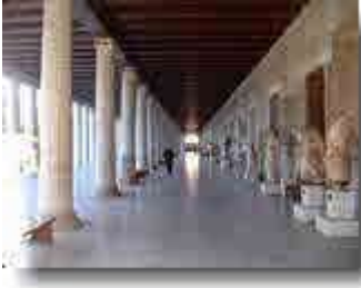
Stoa des Attalos

majestätisch der Hephaistos-Tempel, auf der linken Seite die rekonstruierte Stoa des Attalos, eine riesige Säulenhalle.