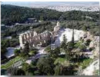
Agora und Hephaistos-Tempel

Die Akropolis, übersetzt "Hochstadt", wurde erstmals in der zweiten Hälfte des 2. Jts. v. Chr. besiedelt, auf dem höchsten Punkt befand sich zunächst ein Königspalast.