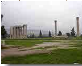
Tempel des Olympischen Zeus