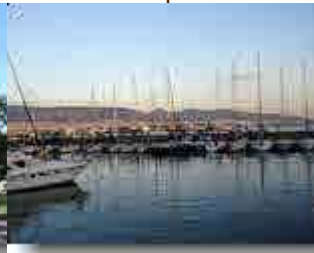
Abendstimmung in Piräus