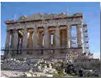
Odeion des Herodes Attikos

Der Tempel, auch Theseion genannt, gilt als besterhaltenes Gotteshaus der griechischen Antike. Er erhebt sich auf einer Terrasse, von der man einen guten Blick auf das alte und aktuelle Athen hat.