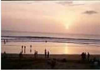
Bali / Kuta