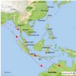
Landkarte von StepMap

Das legendäre Raffles-Hotel sehen wir nur von außen, unser nächster Gang führt uns zum Merlion, dem Wahrzeichen Singapurs. Besonders beeindruckt hat mich diese wasserspeiende Löwenfigur aber nicht.