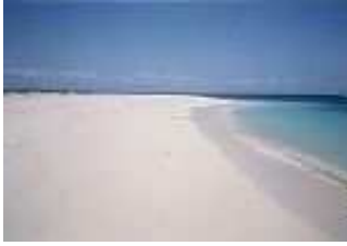
Great Barrier Reef