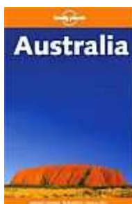
Lonely Planet: Australia