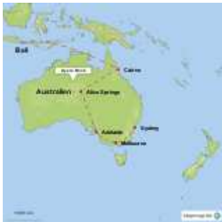
Landkarte von StepMap

An diesem Abend können wir das Kreuz des Südens gut erkennen.