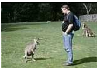
Adelaide: Cleland Conservation Park