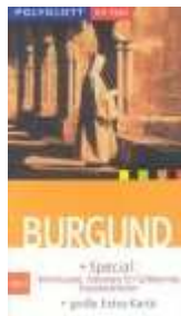
Polyglott On Tour - Burgund

Dijon gilt als Hauptstadt der Gourmets und wir haben die Gelegenheit wahrgenommen, unser Geld zusammengekratzt und einen Abend in einem Sternerestaurant geschwelgt.