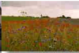
"alles nur Senf"