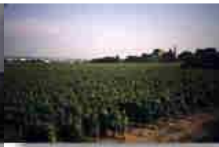
unterwegs in Burgund