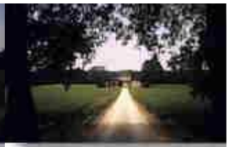
unterwegs in Burgund