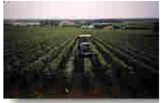
unterwegs in Burgund