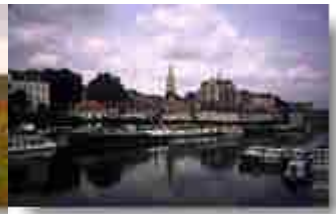
Blick auf Auxerre