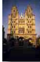
St-Michel in Dijon