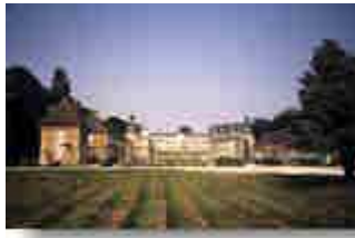
Chateau bei Bresse