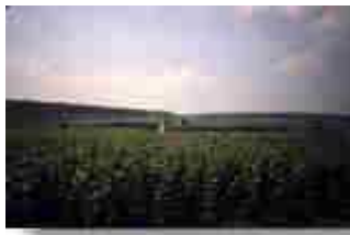
unterwegs in Burgund