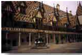
Hotel.Dieu in Beaune