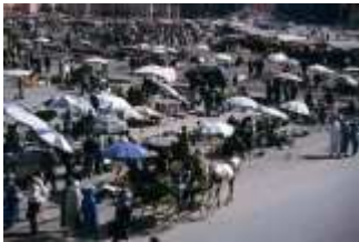
Platz der Geköpften