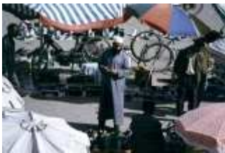
Platz der Geköpften