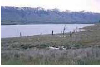
Abgestorbene Bäume in der Nähe des Gletschers