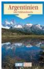
Argentinien und Falklandinseln. Richtig...