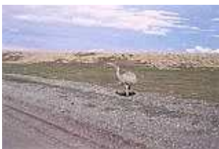
Ñandu bei Punta Arenas

Baldachin den vielen Menschen an Schachtischen Schutz und Schatten.