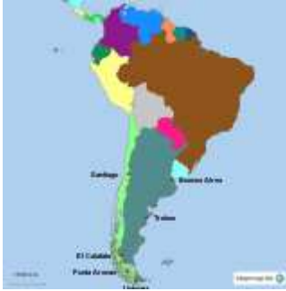
Landkarte von StepMap