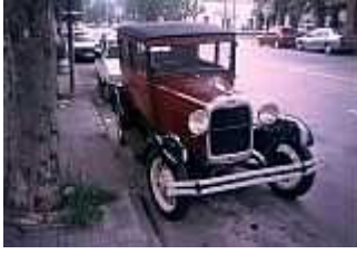
Straßenansicht in Colonia/Uruguay