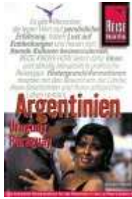
Argentinien mit Uruguay und Paraguay.