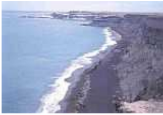
Seehundkolonie auf der Halbinsel Váldez