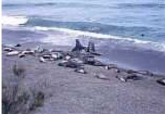
See-Elefanten auf der Halbinsel Váldez