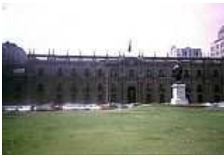
Präsidentenpalast "La Moneda" in Santiago