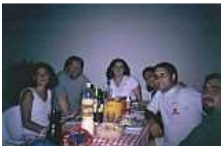
Asado auf dem Dachgarten