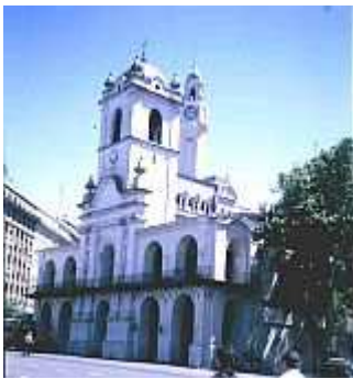
Cabildo in Buenos Aires