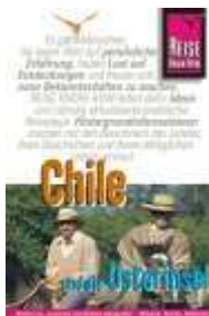
Chile und die Osterinsel.