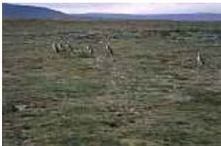
Pinguine bei Punta Arenas