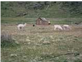
Alpacas bei Chalten

Der Umtausch der chilenischen Währung erweist sich als außerordentlich schwierig. Ich stehe bei einer Bank vor dem "Change"-Schalter in der Schlange und erfahre nach über einer halben Stunde, dass chilenische Pesetas nicht getauscht werden. Bei der nächsten Bank warte ich genauso lange, bin aber, nachdem ein Angestellter sich telefonisch in Buenos Aires rückversichert hat, erfolgreich.