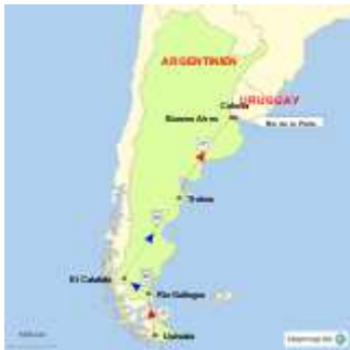
Landkarte von StepMap

Buenos Aires vergleiche ich sofort mit Paris, das