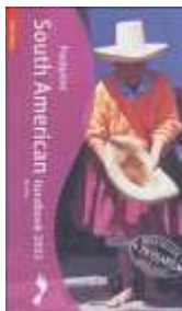
South American Handbook