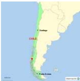
Landkarte von StepMap

die Hospedaje Independencia, zum Glück ist gerade noch genügend Platz vorhanden. Im Ort versende ich einige e-mails und decke mich im Supermercado mit dem Nötigsten ein. In unserer Unterkunft wird schon geheizt, in der Küche steht ein alter Küppersbusch-Herd von der Art, die ich noch aus meinen Kindheitstagen kenne. Zwei niedliche Katzen wärmen sich hinter dem Herd. Beim Frühstück begegne ich zwei Norwegerinnen, sie waren vorher in Cusco und La Paz.