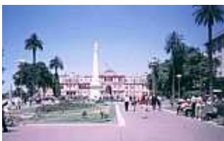
Casa Rosada in Buenos Aires