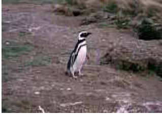
Pinguin bei Punta Arenas