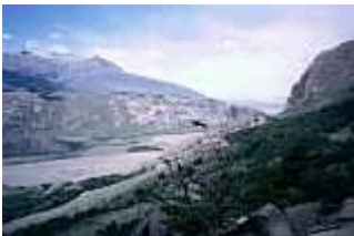
Landschaft bei Chalten