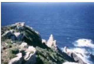
Kap der Guten Hoffnung, Cape Point

mit knapp 3 Mio. Einwohnern zweitgrößte Stadt Südafrikas. Auf dem Plateau ist allerhand los, Schulklassen, Touristengruppen und einzelne Besucher spazieren umher, genießen die Aussicht, lassen sich fotografieren oder staunen, dass es auf einer Bergspitze eine so ebene Fläche gibt. Klippschliefer, eine Tierart, die ich vorher noch nie gesehen habe, streifen über die Klippen.