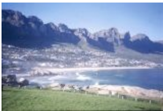
Unterwegs am Kap