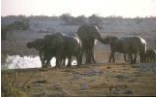
Elefanten im Etosha National Park