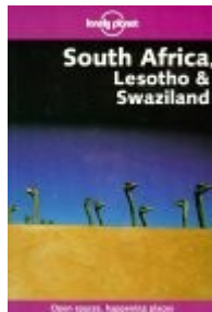
Lonely Planet: South Africa, Lesotho & Swaziland