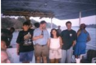
Sundowner auf dem Sambesi

Die andere Gruppe, so hören wir nach der Rückkehr ins Camp, hat noch eine Büffelherde gesehen. Es stört mich etwas, dass die Guides nicht an unserem Abendessen teilnehmen und sich abseits hinsetzen, Relikte der Apartheid? Sie fangen Fische und legen sie lebend aufs Feuer, wir dürfen davon kosten. Einer unserer Begleiter hat nur ein Bein, auch er stakt stehend auf dem Mokoro. Auf diesem Lagerplatz bleibe ich nachts erst recht im Zelt und warte mit allen Geschäften, bis es hell wird. Die Exkrememente müssen eingegraben werden.