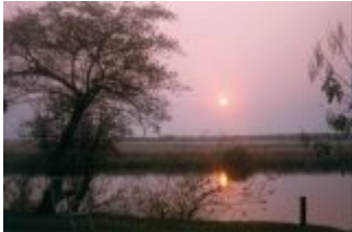
Abendstimmung am Okavango

Pünktlich zum Sonnenaufgang sind wir an den Sossusvlei-Dünen. Erste Sonnenstrahlen streicheln die bis zu 300 m hohen Sandberge und erzeugen ein Schattenspiel, wie ich es noch nie vorher gesehen habe. Diese Konturen, es ist unvorstellbar schön.