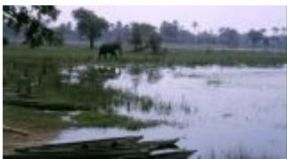
Im Okavango Delta:

Vom Flughafen Maun starten die Kleinflugzeuge zum Flug ins Okavango-Delta. Wir packen das Nötigste zusammen und lassen das Hauptgepäck im Bus. Die Cessna 210 braucht knapp 20 Minuten. Antilopen und Gnus sind von oben gut zu erkennen und natürlich auch das Flussdelta, zumindest ein Teil davon. Sofort nach der Landung bevölkern Paviane wieder die Start- und Landebahn.