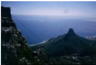
Blick vom Tafelberg