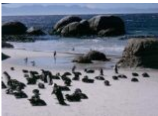
Pinguin-Kolonie auf dem Kap