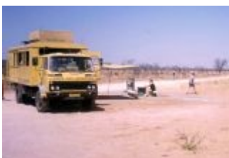
Pause in der Wüste

Auch in Namibia das gleiche Bild, Sand, Geröll, Steine und Berge in der Ferne. Ein Schäfer treibt seine Herde mit einem Jeep vor sich her.