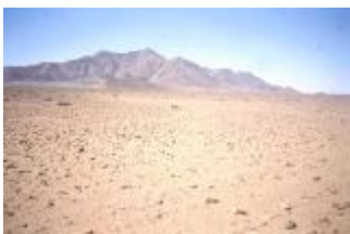
In der Namib Wüste