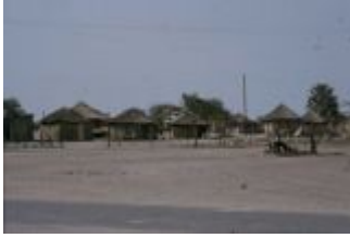
Unterwegs in Botswana