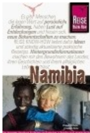
Namibia - Reise Know-how