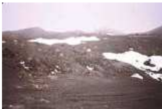
auf dem Ätna