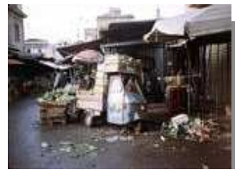
Wochenmarkt in Palermo