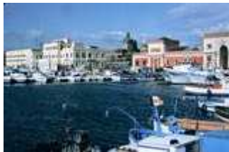
Hafen von Catania