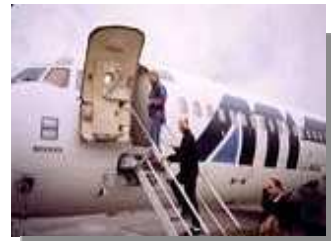
auf dem Heimflug