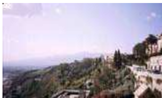
Blick auf den Ätna

wir, ob auch Kreditkarten oder Euroschecks akzeptiert werden. Der Wirt verneint und droht mit der Polizei, wir murmeln nur „Mafia“. Harms schlägt vor, unsere gesamten Devisen auf den Tisch zu legen, vielleicht finden wir ja einen Kompromiss.