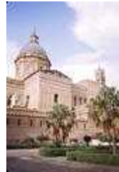
Kathedrale in Palermo