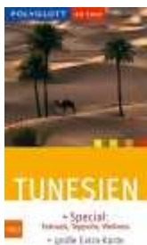
Polyglott on Tour: Tunesien

Am 14.04.1999 am Abend besteige ich das Flugzeug und gut 2 ½ Stunden später sind wir bereits in Monastir, dem Zielflughafen. Jetzt noch ca. 1,5 Stunden mit dem Bus und kurz nach Mitternacht erreiche ich das im Zentrum der Stadt liegende „Hotel Emira“. Glücklicherweise hat die Bar noch geöffnet. Die Kellner sprechen durchweg Deutsch, man gut, denn mit meinem Schulfranzösisch kann ich zwar leidlich Bestellungen aufgeben, aber keine Frage beantworten, denn ich verstehe sie gar nicht mehr.