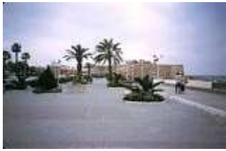
Medina in Hammamet

Am Spätnachmittag erreichen wir Douz am Rande der Sahara. Die Kameltreiber warten schon und fordern uns auf, uns wie Berber zu verkleiden. Mir ist das zu albern und ich steige in ziviler Kleidung auf mein Kamel. Dann reiten wir in die Wüste hinein. Nach kurzer Zeit ist nur noch Sand vor, neben und hinter uns zu sehen, gewaltige