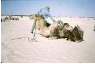
In der Sahara