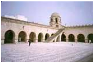
Moschee in Sousse