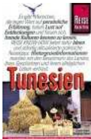
Ursula u. Wolfgang Eckert: Tunesien