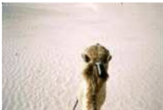
In der Sahara