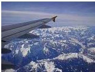
Über den Alpen