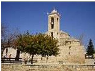
Kirche in Geroskipou

gefüllte Autobus in Bewegung. Ich habe auch erlebt, dass er über fünf Minuten vorher abfährt oder mit 15-minütiger Verspätung. Man sollte immer rechtzeitig da sein.