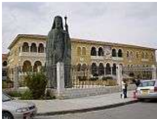
Bischofspalast mit Makarios-Statue