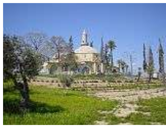
Moschee am Salzsee