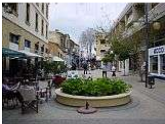
Grenze in der Ledra-Straße