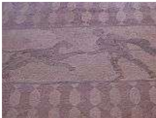
Haus des Dionisos