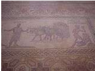
Haus des Dionisos