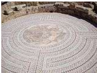
Haus des Theseos