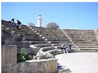
Odeon in Pafos

Gaitonia, an Souvenirshops, kleinen Restaurants und Bars mangelt es nicht.