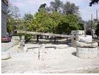
Olivenpresse in Limassol