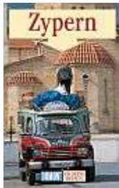
Zypern, richtig reisen